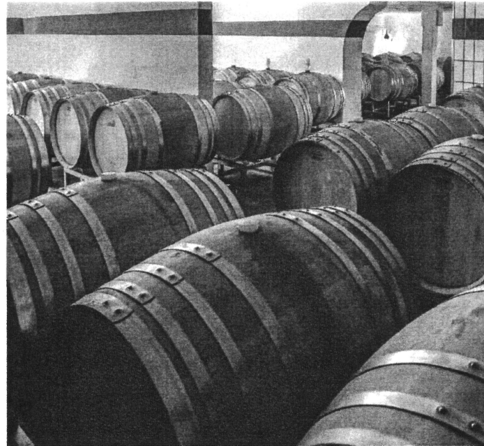
Barriquekeller bei Nauer Weine